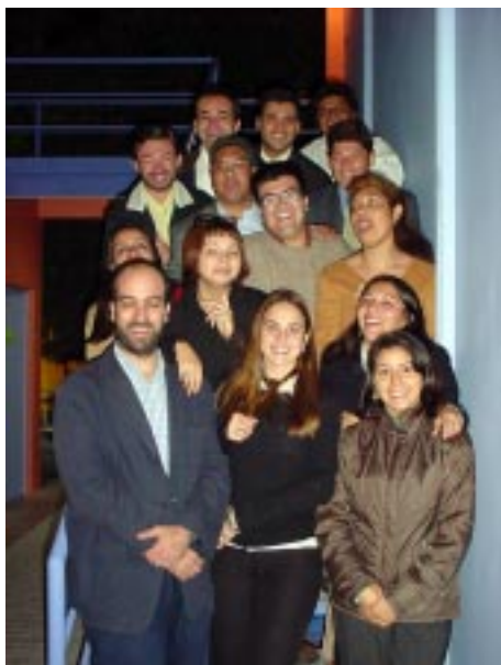
Equipo 2003 de la Fundación Trabajo para un Hermano - Atacama

Sin la confianza que depositan en la Fundación, los Servicios Públicos que aprueban las propuestas presentadas por la Fundación, las autoridades por la importancia de establecer redes y trabajar en conjunto, los Municipios por la importancia de trabajar desde el mismo territorio de una forma coordinada, las empresas que muchas veces anónimamente apoyan iniciativas de la Institución, las agencias privadas nacionales e internacionales quienes han confiado en reiteradas ocasiones en el accionar de la Fundación, colaboradores y amigos en todas las comunas de la Región, las Ongs con las que nos relacionamos y coordinamos y principalmente los microempresarios y microempresarias que confían en las acciones y el apoyo de la Fundación, hubiera sido imposible llegar a los 9 años de la Institución con la trayectoria recorrida y las proyecciones que se nos presentan. Gracias a cada uno de ustedes por su apoyo. También un recuerdo muy especial en este 9º aniversario al Obispo Emérito de Copiapó, Don Fernando Ariztía, quien impulsó la creación del TPH - Atacama.